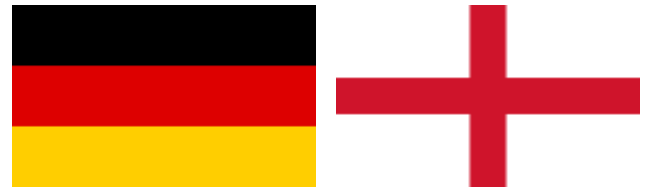
Duitsland – Zuid-Engeland