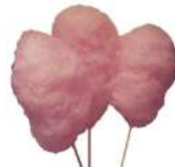
Poffertjes en suikerspinnen op het terras!