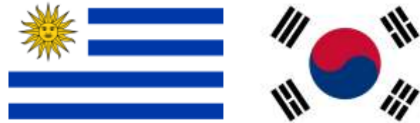
Uruguay – Zuid-Korea