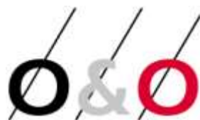
Olde Meule & Oude Luttikhuis