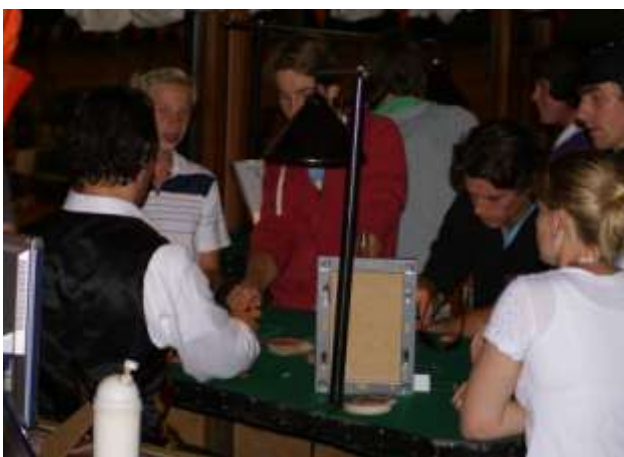
Wie zijn de winnaars en wie de verliezers?